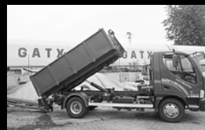
AVIA D100 – 5t / 3-10 m 3