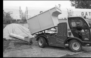
AVIA D120 4x4 – 7t / 4-15 m 3