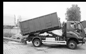
MUVO 4x4 – 2,5t / 2-2,5 m 3