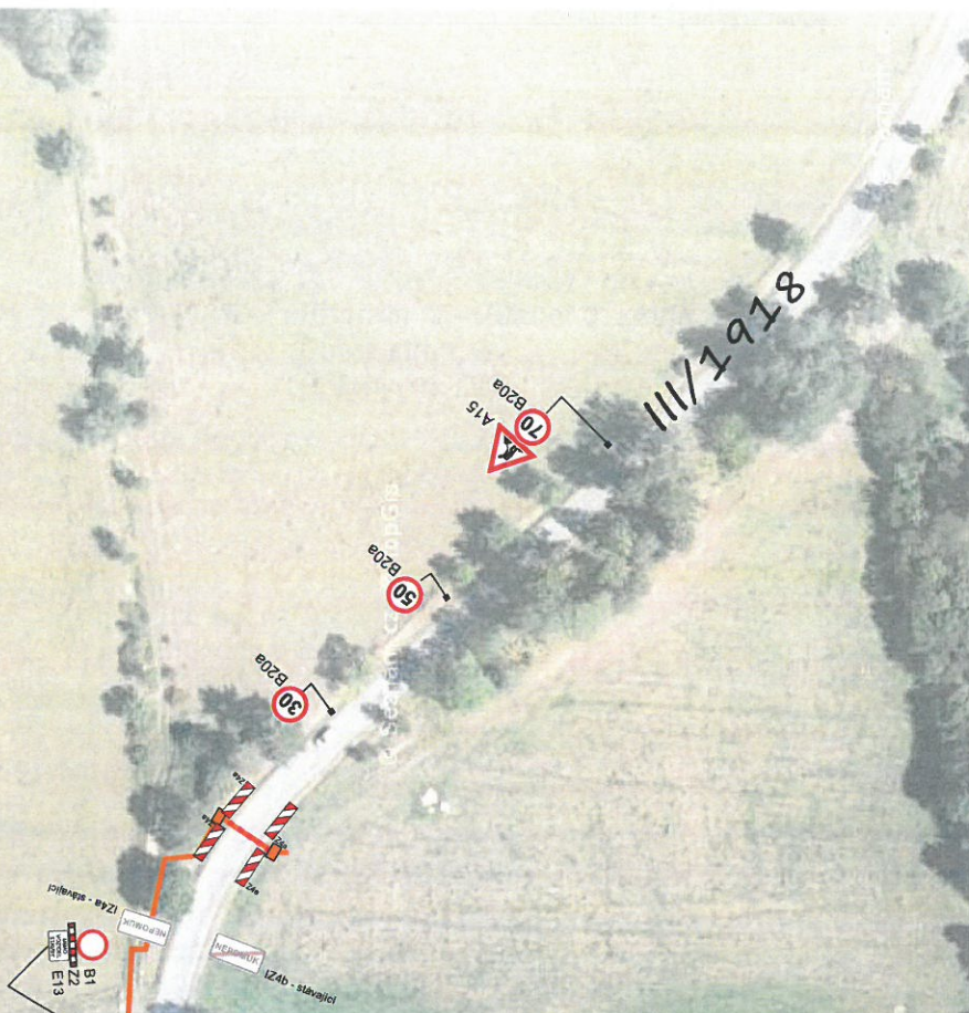
SCHÉMA : PRACOVNÍ MÍSTO V PRACOVNÍ DOBĚ OD 7 00 DO 17 00 HOD.